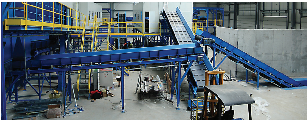
Tak wygląda wnętrze hali sortowniczej.

HUMOR *** Tata, syn i teściowa idą na spacer do lasu. Nagle syn mówi do taty. - Tato, tato dzik zaatakował babcię. A tata na to: - Jak sam zaatakował to niech się sam broni. *** Rozmawia dwóch dresiarzy: - Co robisz w Sylwestra? - Nie wiem ale chyba kłatkę piersiową i bicepsa *** Dzwoni telefon wczesnym ranem. Nowy Rok. Obudzony facet odbiera i słyszy pytanie: - Klinika? - Pomyłka, to prywatne mieszkanie Za krótką chwilę znowu dzwoni telefon i głos w słuchawce powtarza: - Klinika? - Nie! To prywatne mieszkanie!! - Ziutek, no co ty kumpla nie poznajesz? Ja się pytam czy wypijemy klinika nad ranem?!