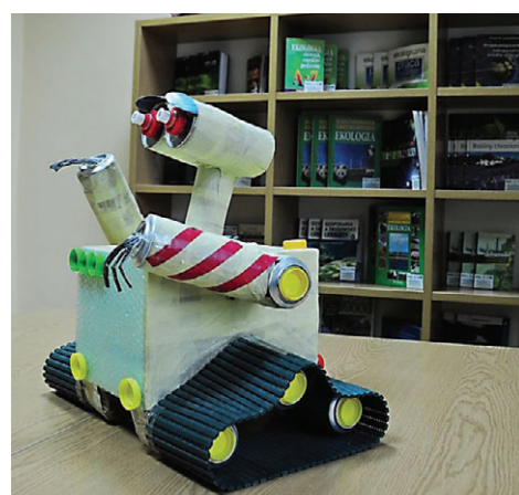
Zakład Gospodarki Odpadami Komunalnymi to nie tylko gospodarka odpadami, ale również edukacja. Na zdjęciu jedna z sal Regionalnego Centrum Edukacji Ekologicznej, które powstało w ramach projektu.